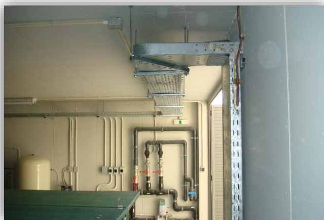
Εικόνα 2. Αποψη από το εσωτερικό της Εγκατάστασης.