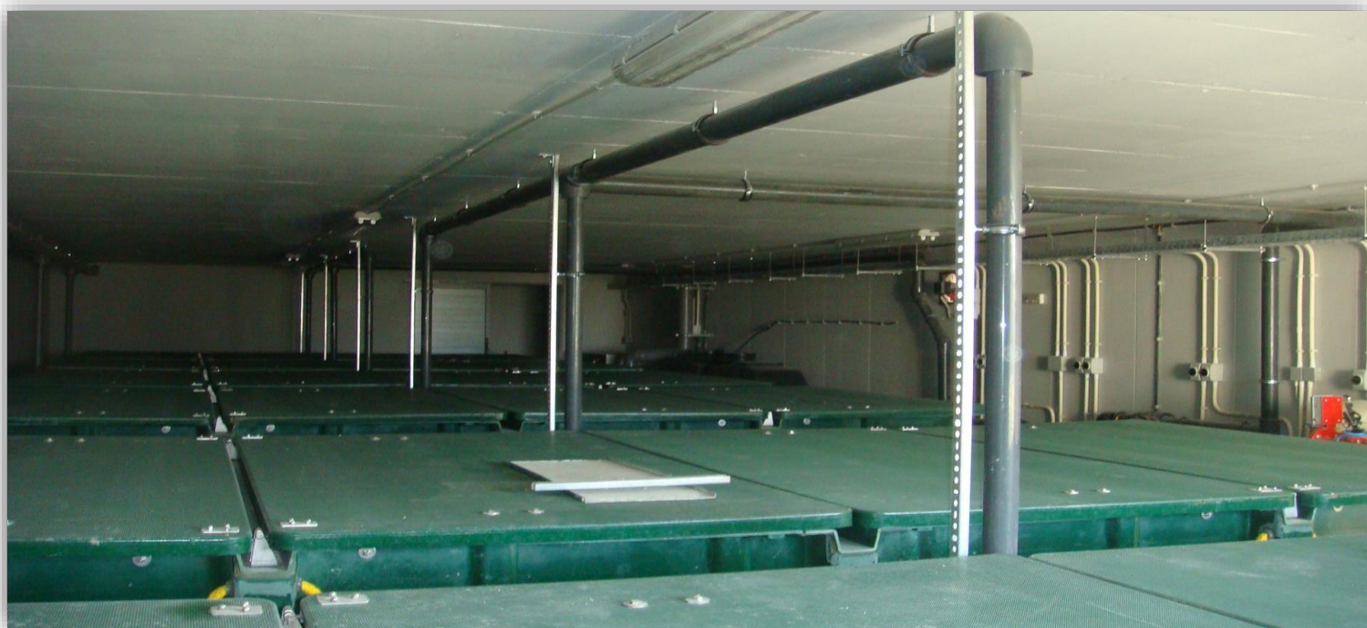
Εικόνα 3. Τα συστήματα AdvanTex στον Σταθμό Επεξεργασίας Λυμάτων.