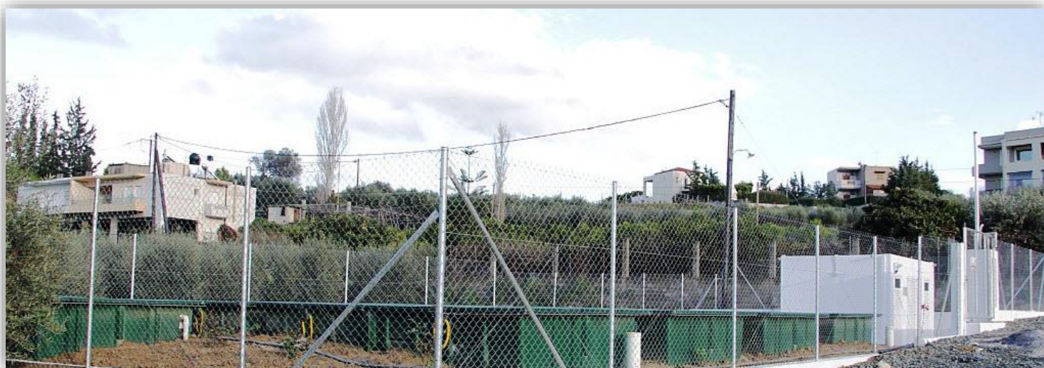
Εικόνα 3 & 4. Η εγκατάσταση του βιολογικού καθαρισμού βρίσκεται πολύ κοντά σε σπίτια του οικισμού. Απόδειξη της άοσμης και αθόρυβης λειτουργίας της μονάδας.