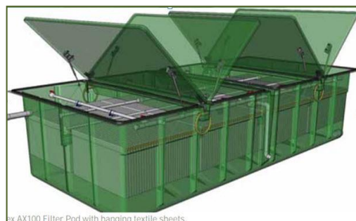
Εικόνα 2. Συστήματα AdvanTex.